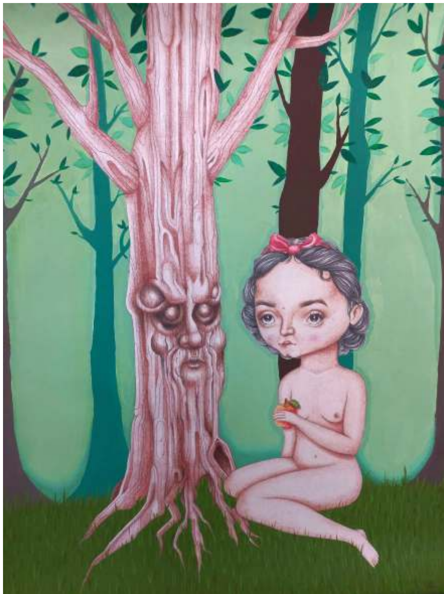
"La manzana de la discordia" Mixta 70 x 50 cm 2022