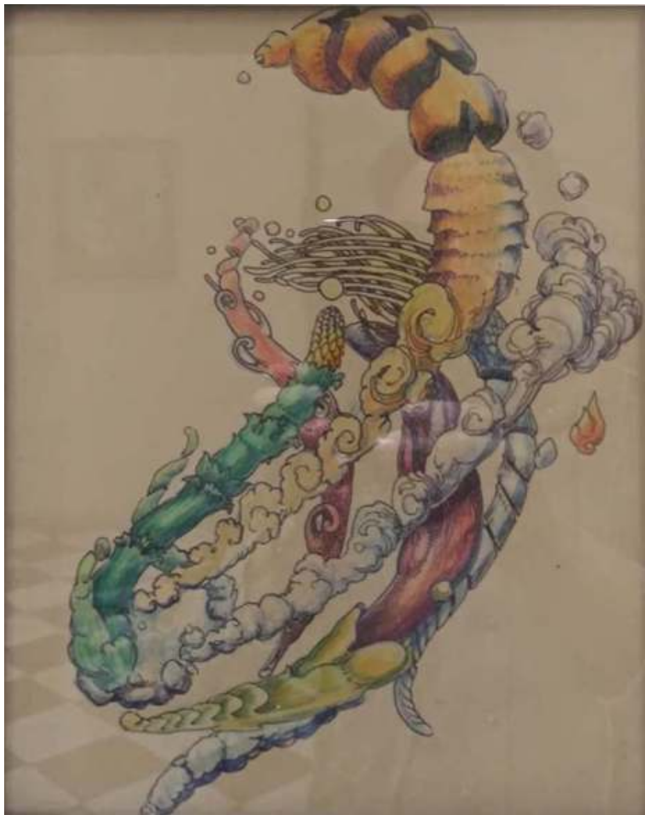
"Este dibujo es para que lo vea Jis" 60 x 40 cm Óleo sobre tela 2019