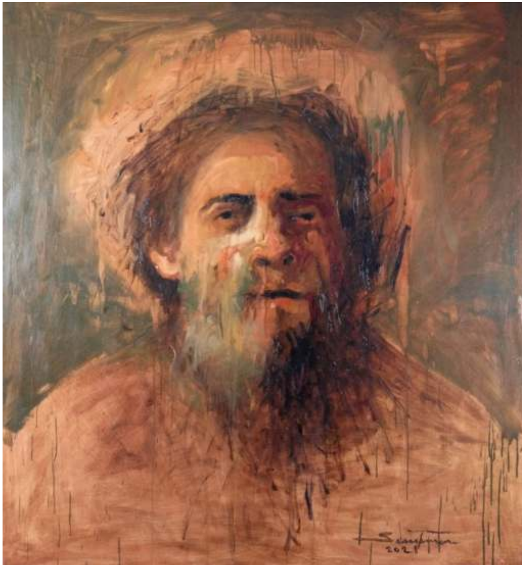
"Debiste haber muerto aquella noche" Óleo sobre tela 105 x 115 cm 2021