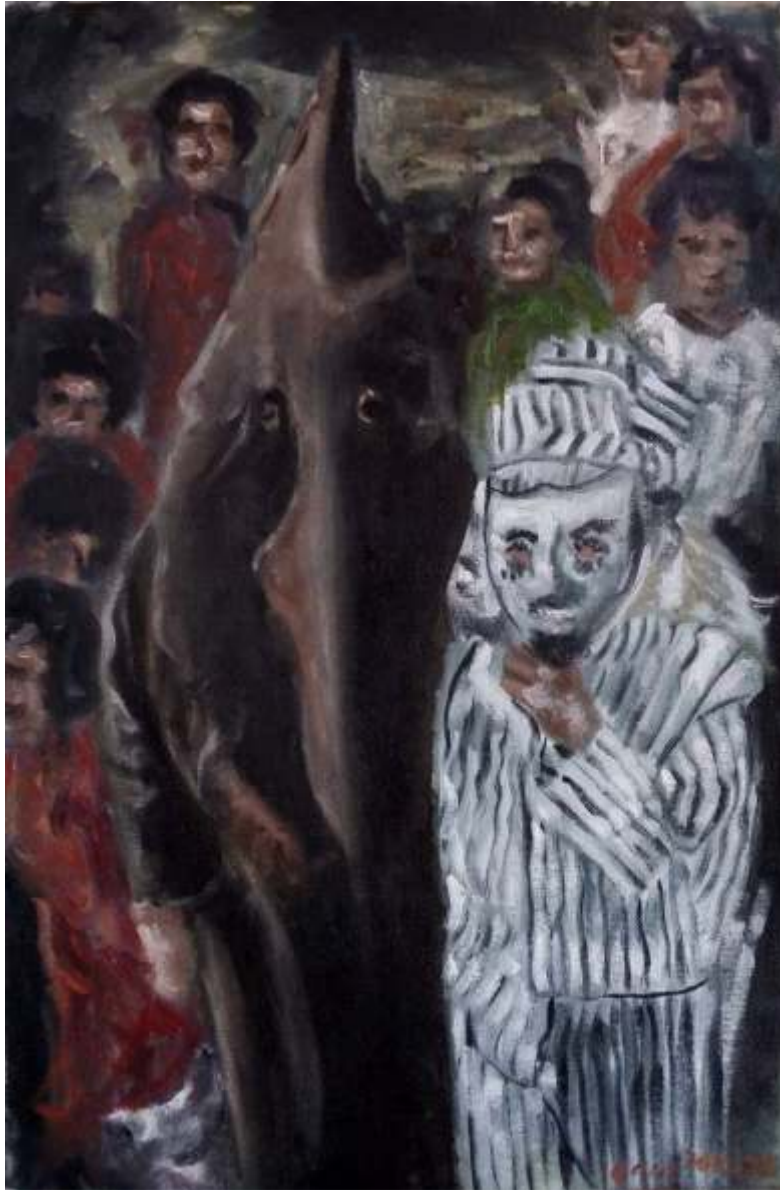
"Calnali" Óleo sobre tela 32 x 50 cm 2021