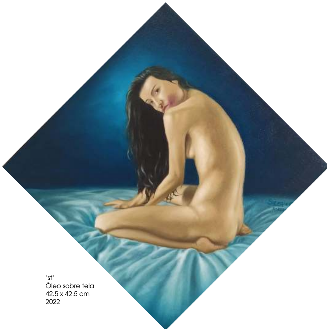
"st" Óleo sobre tela 42.5 x 42.5 cm 2022