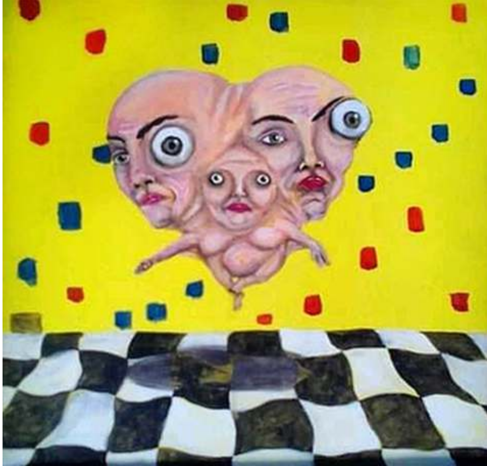
"Nutriente en la turbina" Mixto 50 x 50 cm 2021