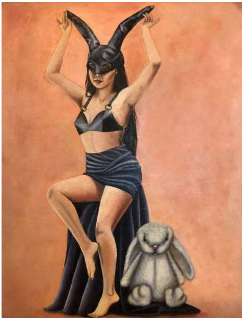
"La fantasía del conejo" Óleo sobre tela 54 x 63 cm 2022