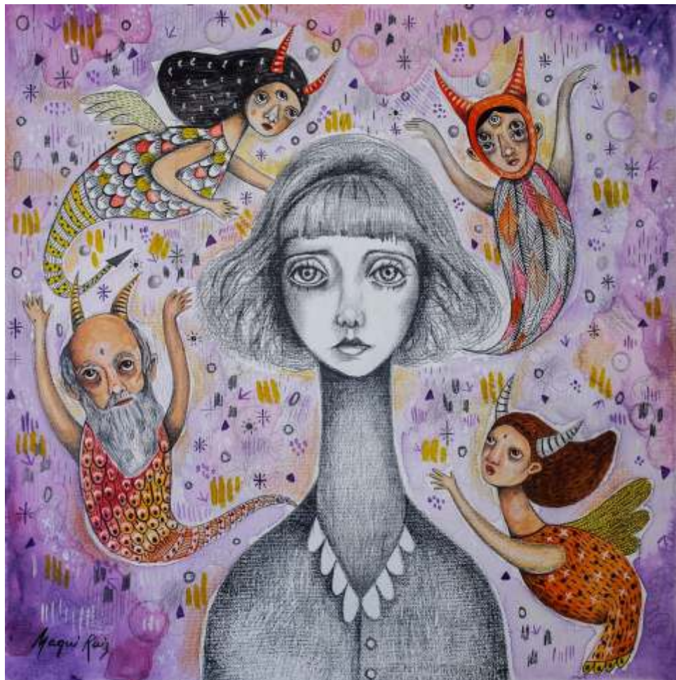
"Los demonios de Nahui" Acrílico y grafito sobre bastidor de tela 30 x 30 cm 2022