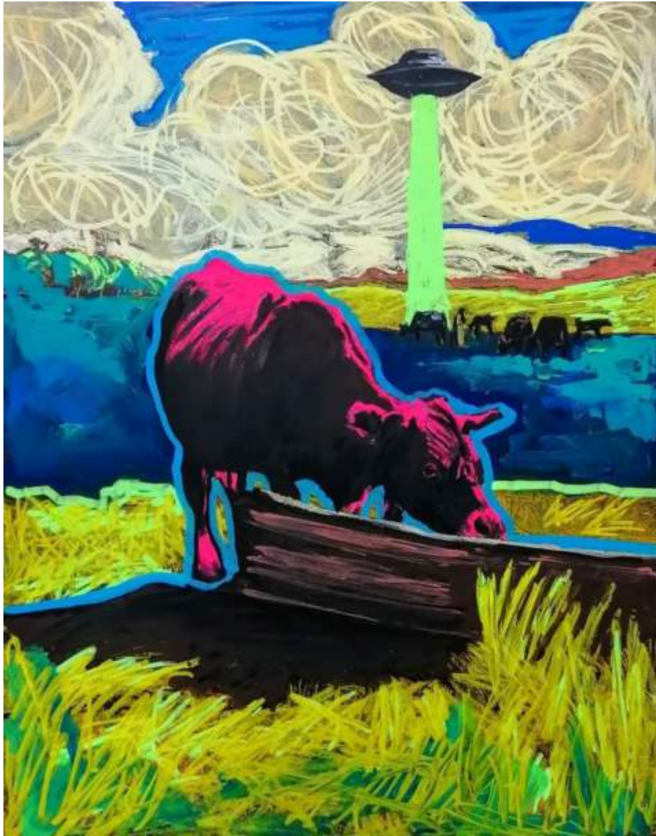
"Taken" Acrílico y molotow/papel 27x21 cm 2022