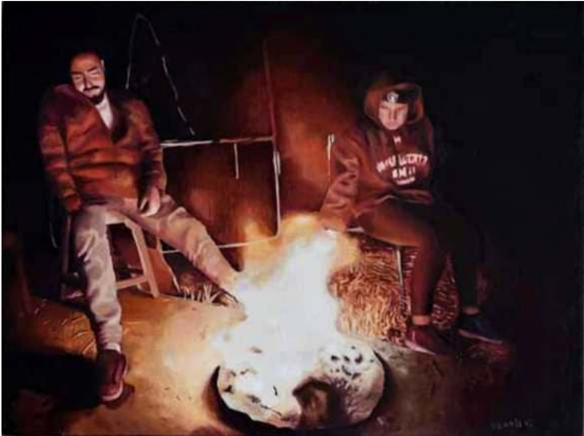
"Pensamientos en fuego" óleo sobre tela 30 x 40 cm