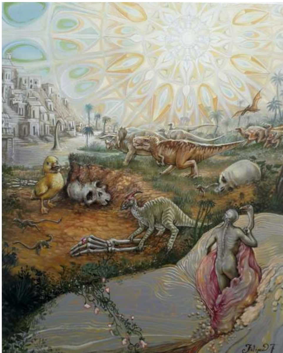
"Paisajes renovables" Óleo sobre tela 70 x 90 cm 2022