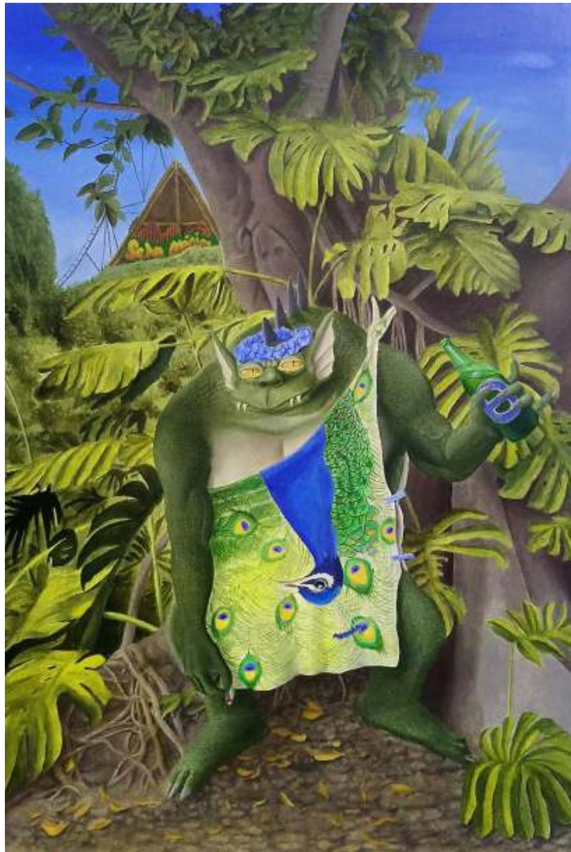
“Baco el Reptiliano” Óleo sobre tela 60 x 90 cm 2022