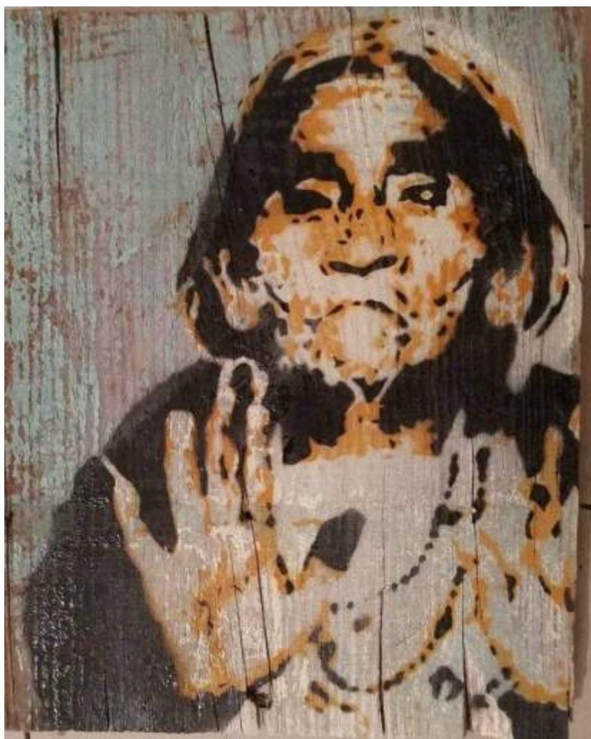
"El viaje de sabina" Stencil/ madera reciclada. 27 x 33.5 cm 2022