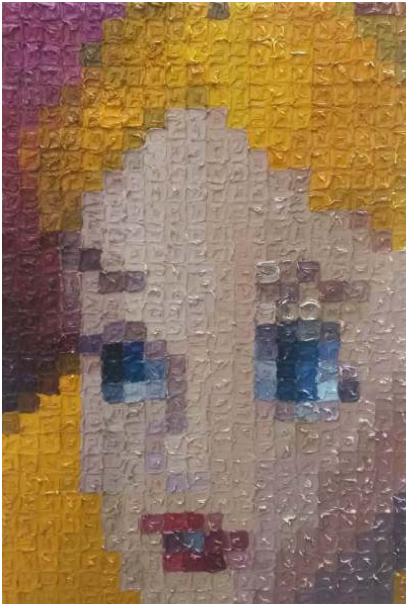
"Alicia" Óleo sobre tela 60 x 40 cm 2019