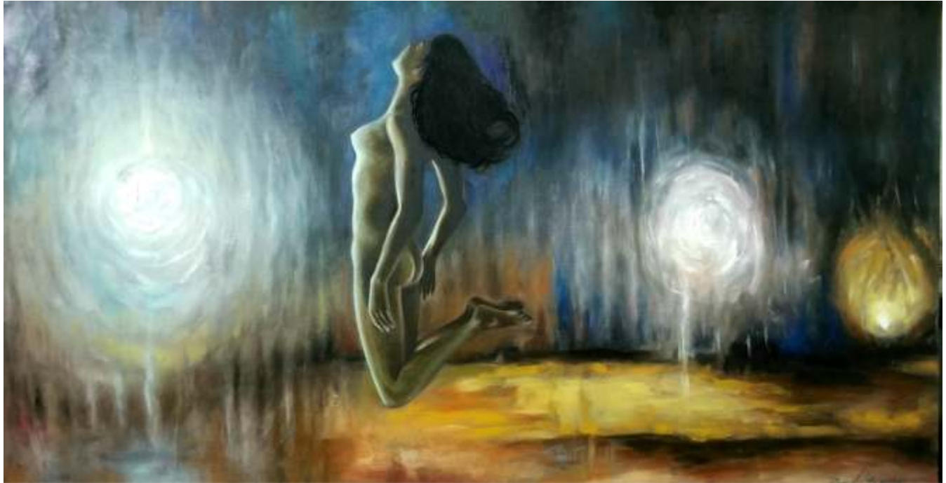
"Ascensión" Óleo sobre tela 54 x 99 cm 2022