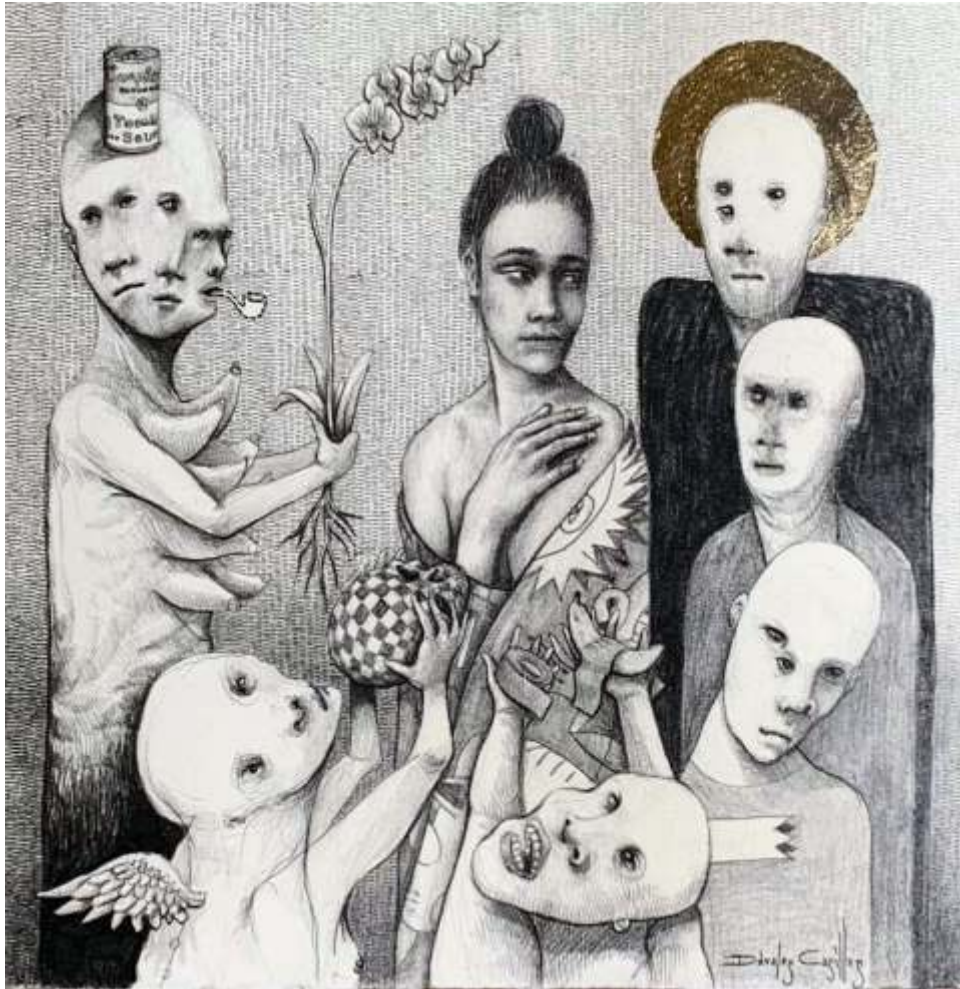
"La Raíz del Arte de Siglos Pasados" Grafito / hoja de oro sobre papel 30 x 30 cm 2022