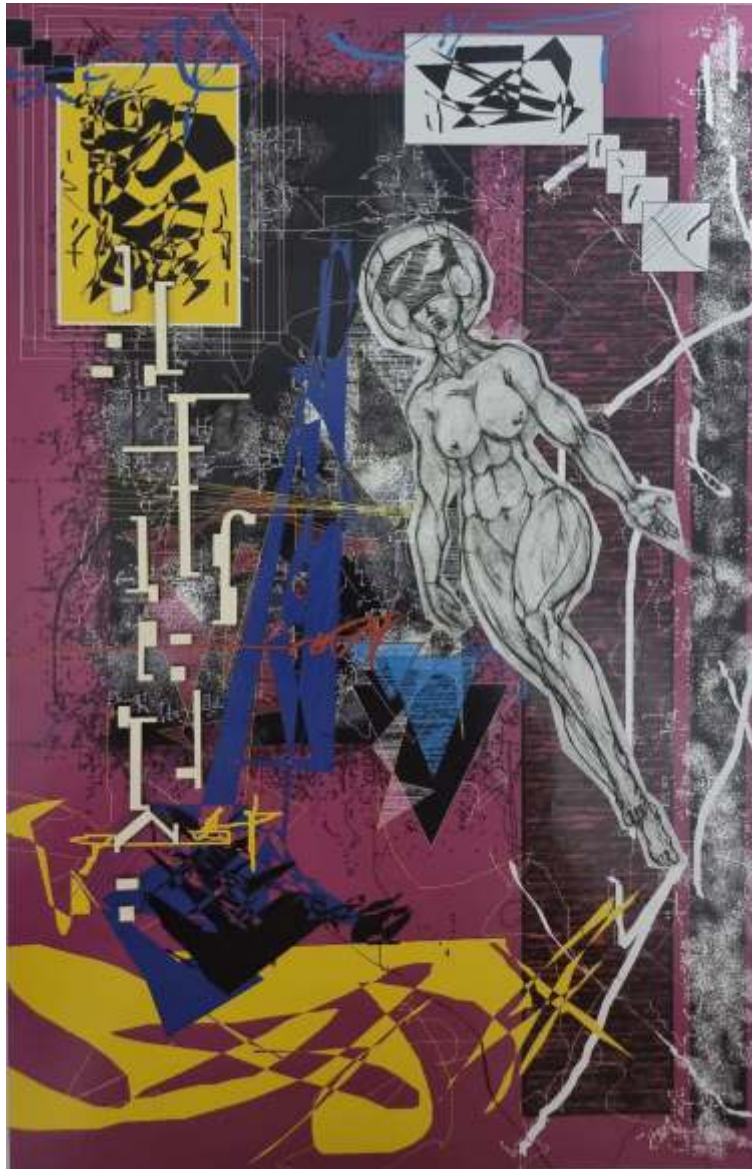
"Nébulas" Collage 30 x 40 cm 2022