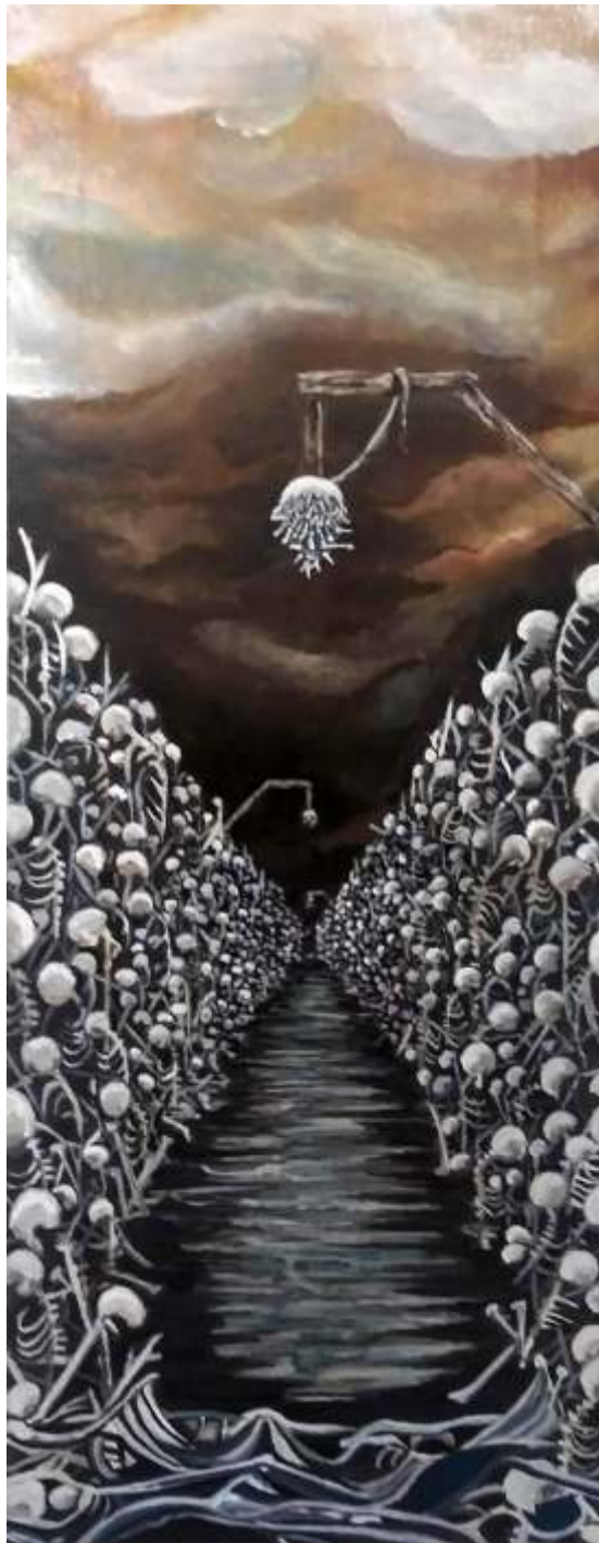
"Cero" Mixta sobre tela 27 x 73 cm