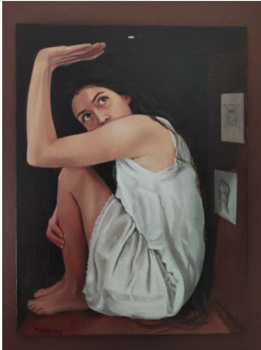
"Cuarentena" Óleo sobre tela 35 x 40 cm