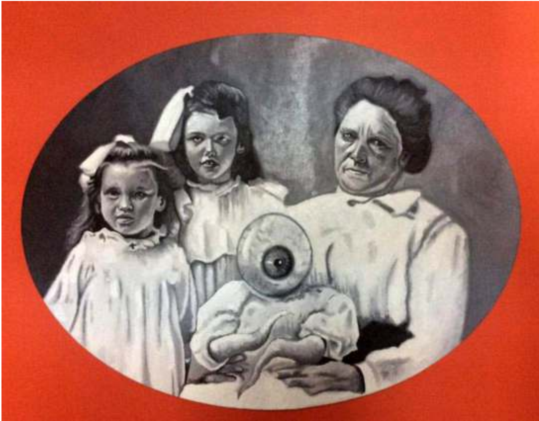
"Retrato de familia y el nuevo mesías" Óleo sobre tela 30 x 40 cm