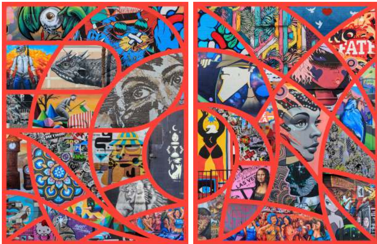
"Radical Arts LV"

Fotografía digital impresa sobre papel Ultra Premium Luster, medida Montado sobre FoamBoard 42 x 55 cm.