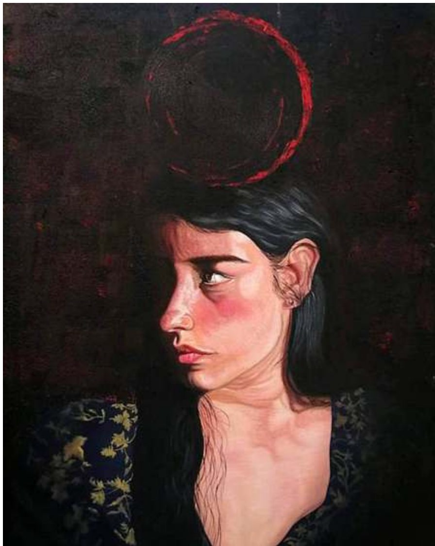
"Eclipse rojo" Óleo sobre tela. 64 x 44 cm. 2022