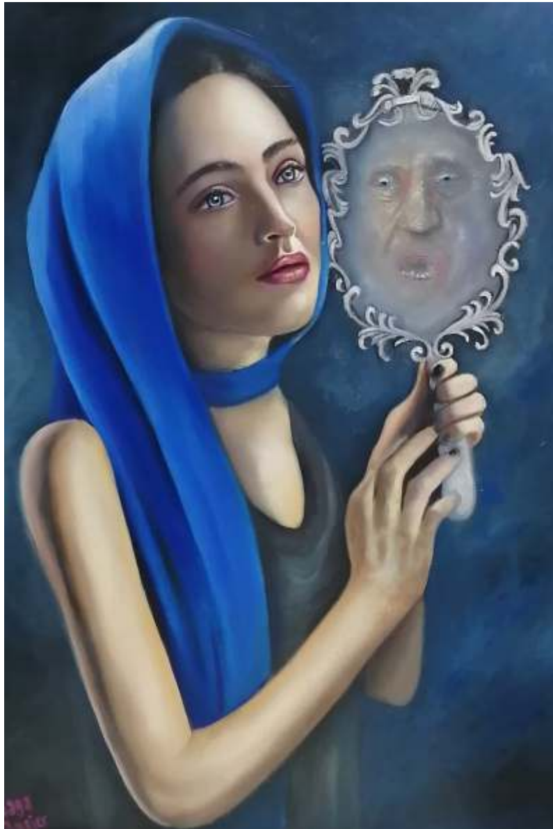
"La vida en el espejo" Óleo sobre tela 70 x 50 cm 2022