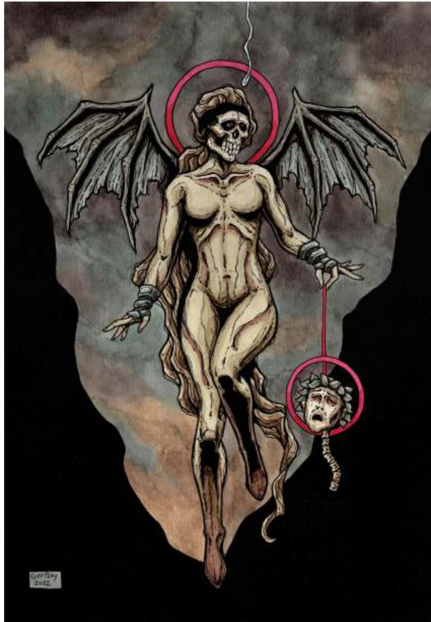
"Bruja" Acuarela, tinta y acrílico 40 x 28 cm 2022