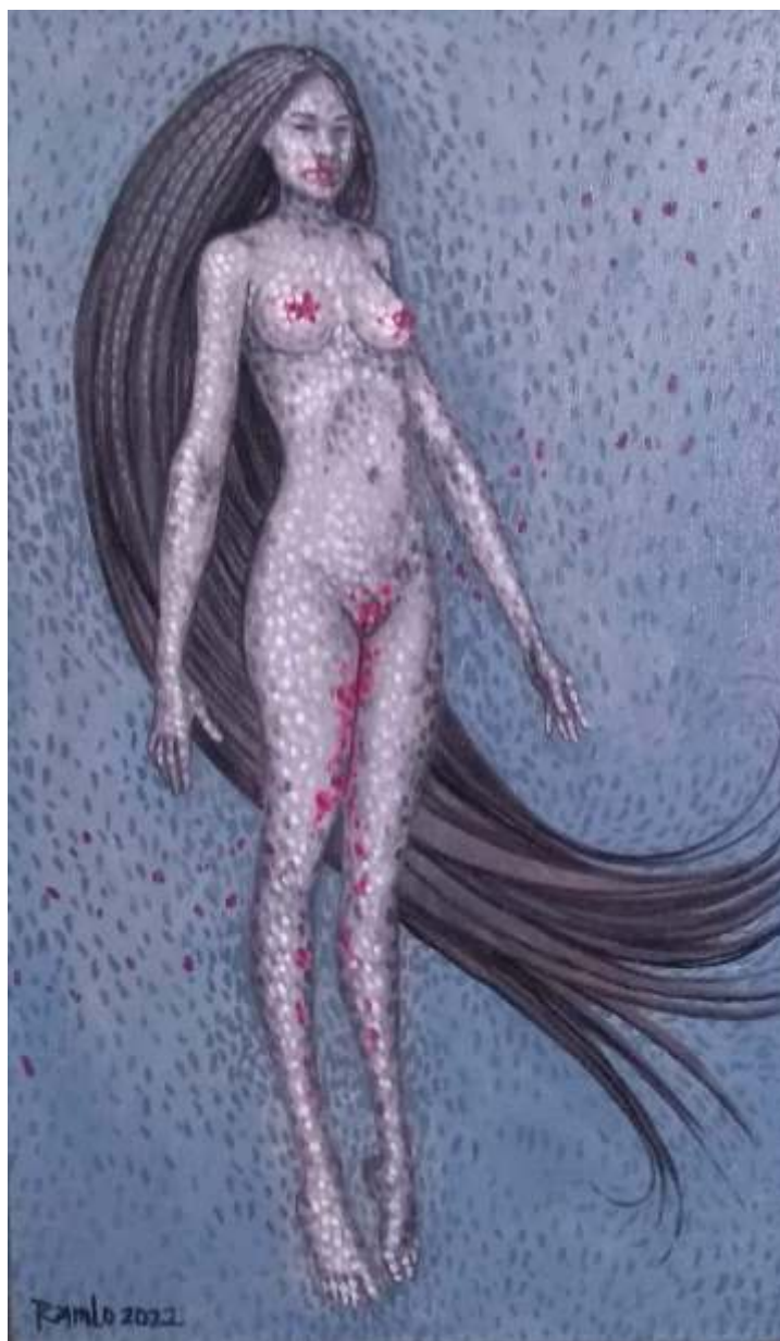
"Naturaleza animal" Óleo sobre tela 49.1 x 29.6 cm 2022