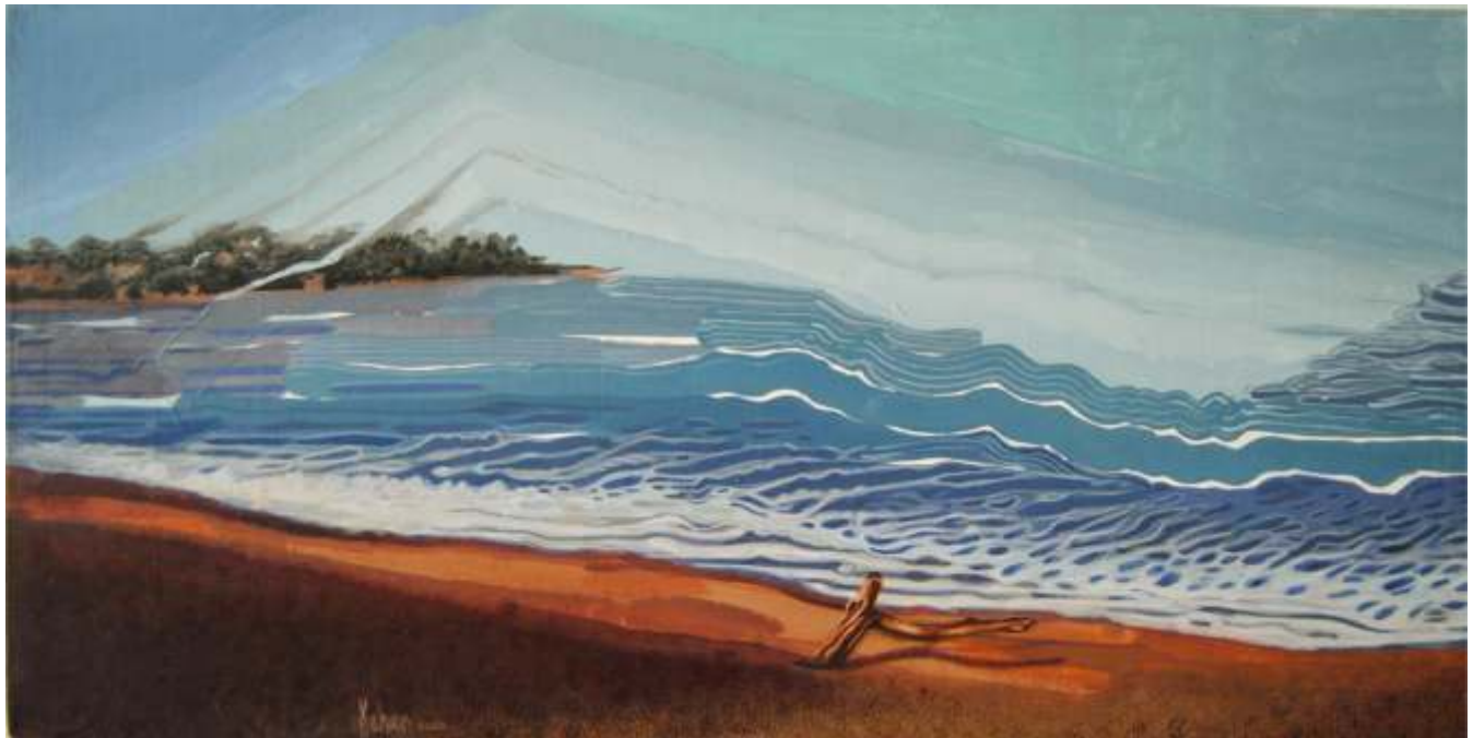
"Paisaje de playa" Acrílico sobre tela 30 x 60 cm 2022